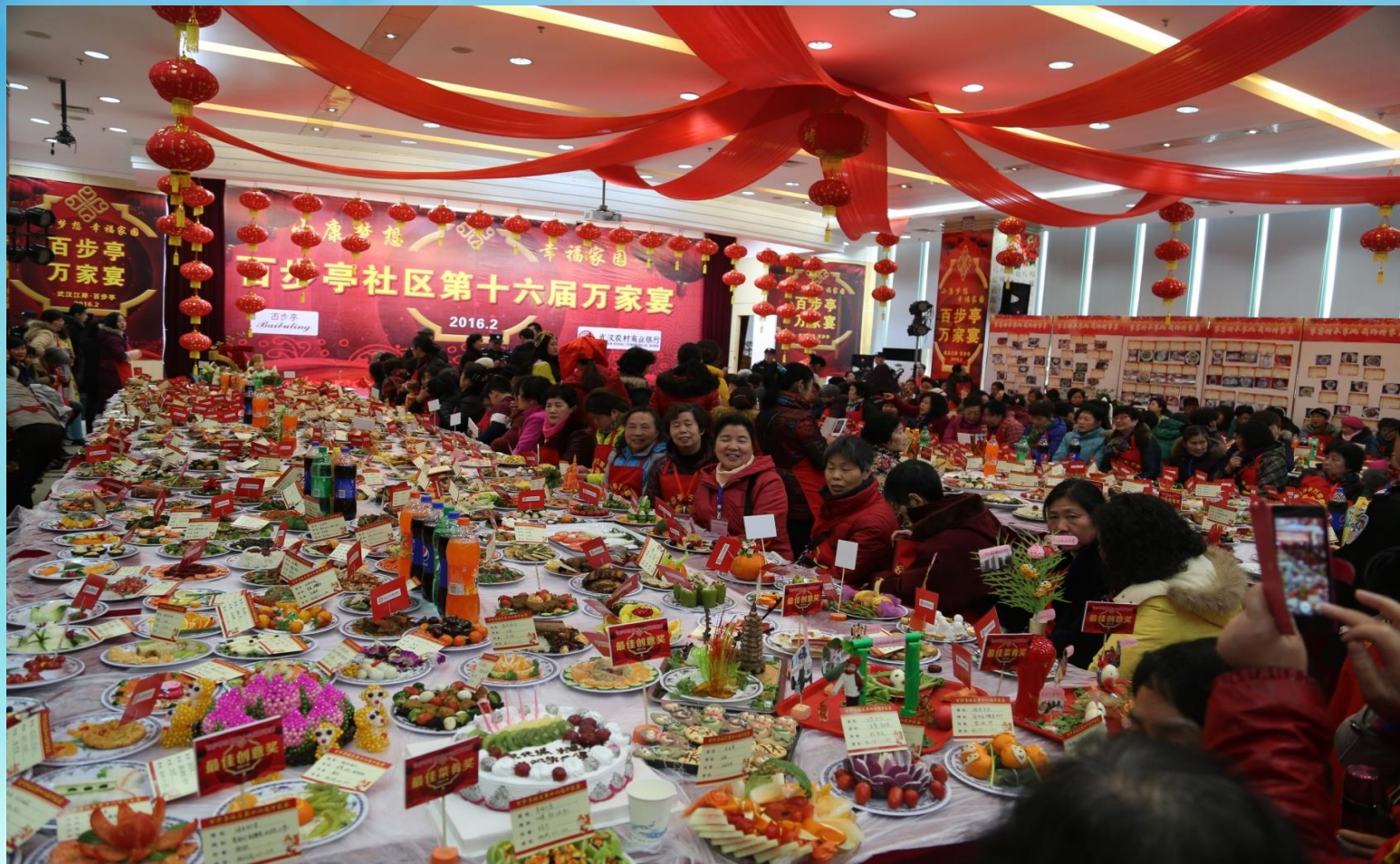
百步亭社区举办第十六届“万家宴”