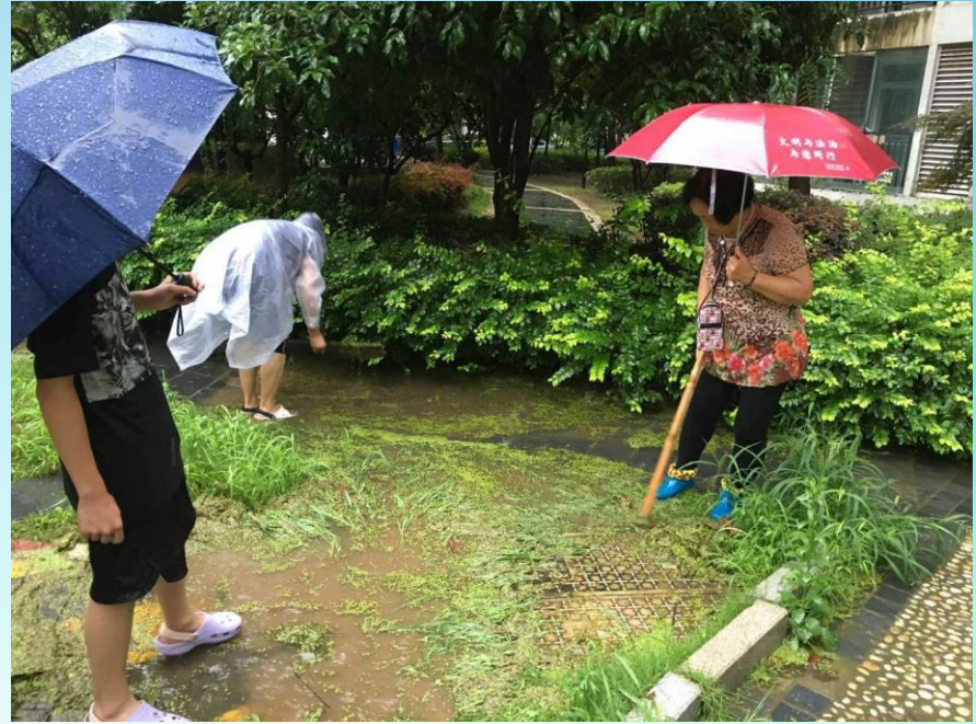
巡逻志愿者与居委会工作人员一同抢排渍水