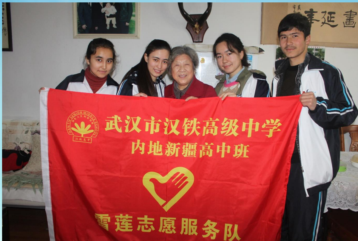
汉铁高中新疆班成立雪莲志愿服务队